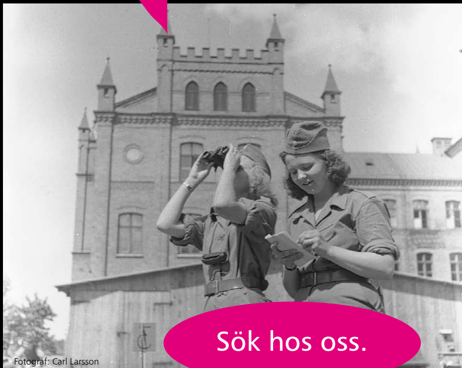
Fotograf: Carl Larsson