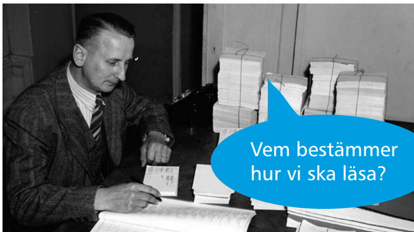
Fotograf: Carl Larsson

Besöksadress: Kungsbäcksvägen 32 Postadress: Länsbibliotek Gävleborg Box 580, 80108 Gävle Telefon: 026-15 59 83 (admin) Hemsida: www.lg.se/lanbib