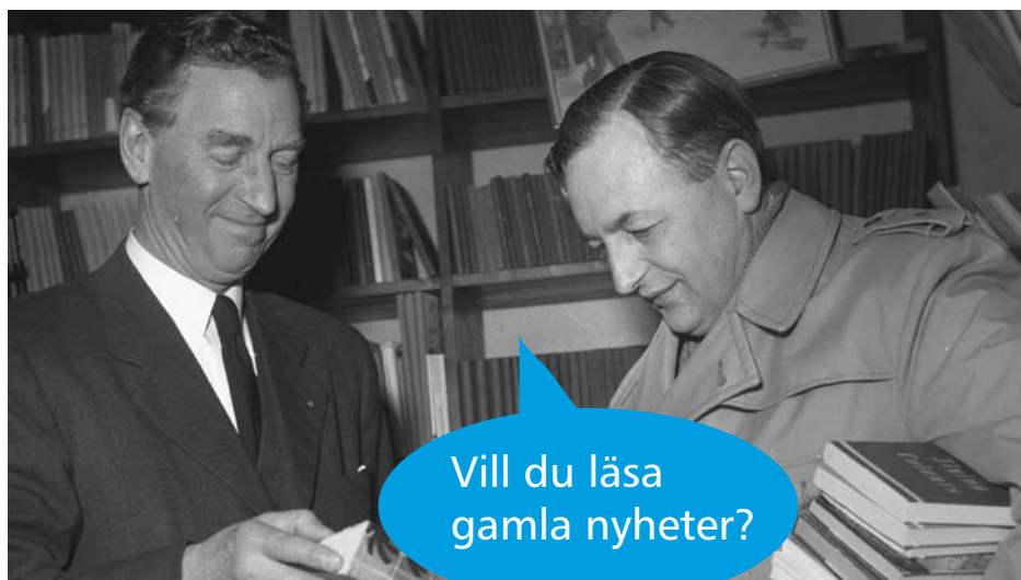
Fotograf: Carl Larsson

Besöksadress: Slottstorget 1 Postadress: Stadsbiblioteket Gefle Vapen, Box 801, 801 30 GÄVLE Telefon: 026-179430, 179441 Hemsida: www.gavle.se/bibliotek